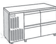
2 X 2 TIROIRS HAUTEUR 210 MM