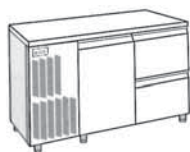
1 PORTE + 2 TIROIRS HAUTEUR 210 MM