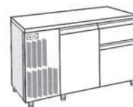
1 PORTE + 2 TIROIRS HAUTEUR 320 + 105 MM